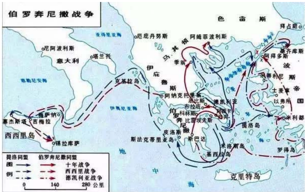
伯罗奔尼撒战争全图