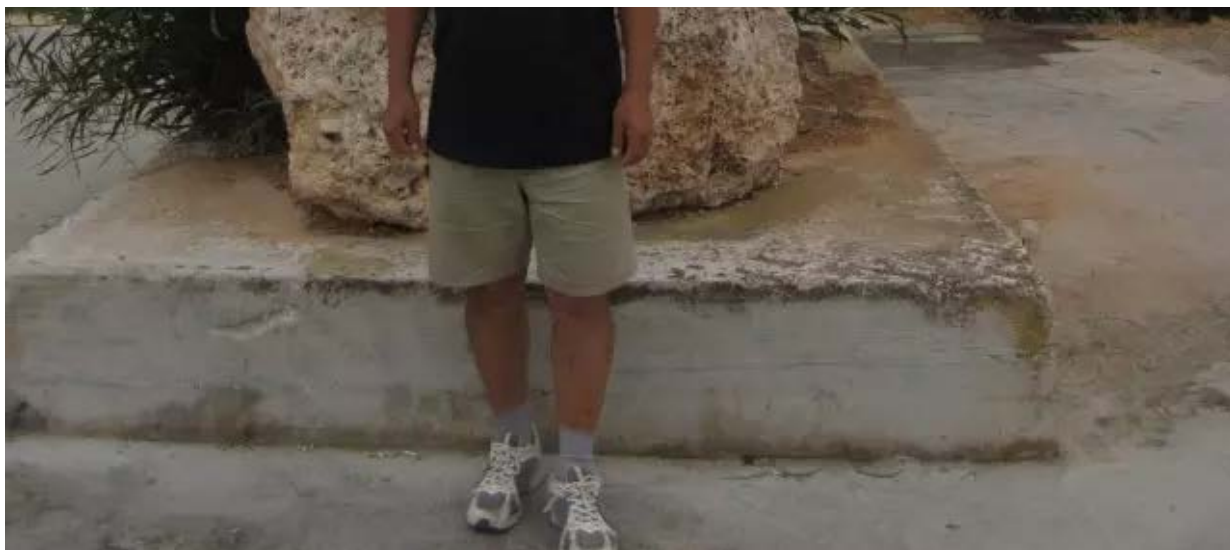
与修昔底德雕像合影